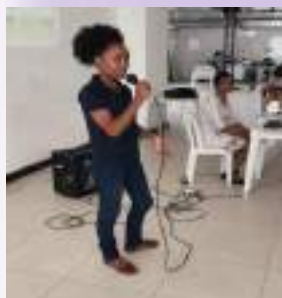
Apresentação do Projeto de extensão: Mete Mão