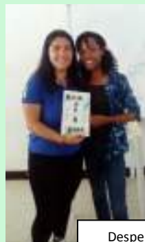
Despedida de Regina