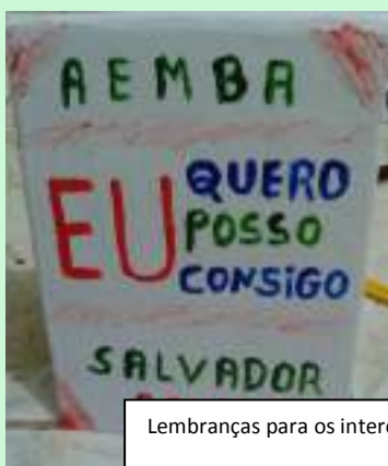
Lembranças para os intercambistas