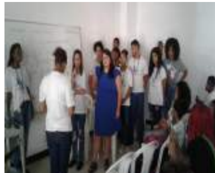
EVENTO: MEU CORPO NÃO É SUA FANTASIA