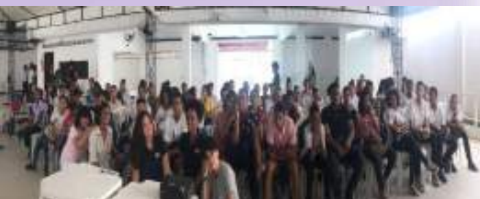
Encerramento das atividades