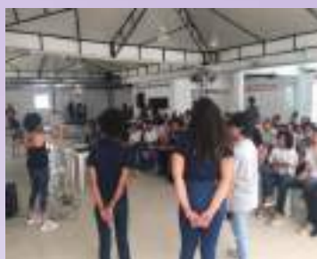
Relato de experiência no PET, BI e CPL